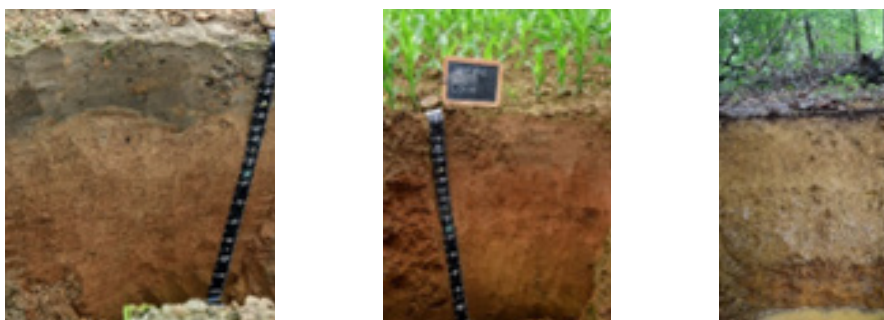
Fig. 3 -4-5. Luvic Anthraquic Stagnosol (Loamic, Aric) sotto risaia (sinistra); Haplic Luvisol (Loamic, Aric, Cutanic, Epydystric, Ochric) sotto mais (Zeme, PV) (centro); Fragic Luvisol (Siltic, Ochric, Bathymanganiferic) presso il Parco Regionale della Mandria (Venaria Reale, TO) (destra).