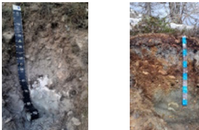
Fig. 1–2. Suoli osservati in Valle d'Aosta: Skeletal Petrocalcic Kastanozem (Loamic) presso Cheverel (Morgex, ca. 1200 m s.l.m.) e Skeletal Albic Ortsteinic Podzol (Loamic, Endoarenic, Endoraptic), presso il Lago di Arpy (2109 m s.l.m., comune di Morgex).

Infine, ritornando verso le Prealpi piemontesi, gli ospiti hanno potuto apprezzare i lembi relitti del quercocarpineto planiziale del Parco La Mandria, caratterizzati da suoli evoluti, sviluppatisi sugli antichi terrazzi fluvio-glaciali pleistocenici (fig. 5).